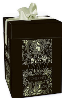
fondente extra 90%. 350 gr. € 16.50

Le uova di cioccolato E-Quality esprimono l'eccellenza del cioccolato in 4 golose proposte in scatole regalo. Non contengono sorprese all'interno, perchè la vera sorpresa è il Gusto.