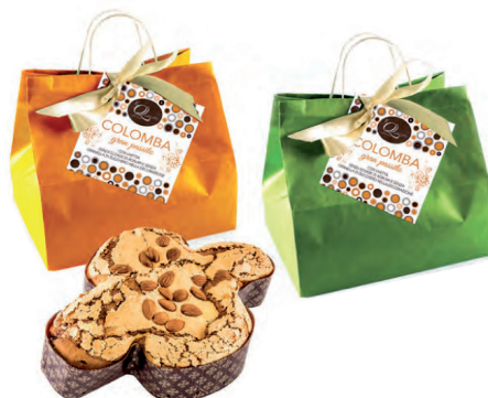
colomba gran passito con glassa e mandorle ed uvetta in infusione in vino da uve Moscato doc passito 700 gr. € 16.90