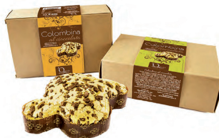
colombina al cioccolato con granella di nocciole 100 gr. € 3.30