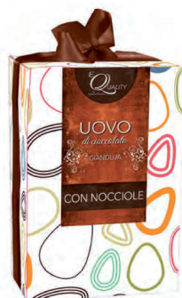
gianduja con nocciole. 350 gr. € 17.90