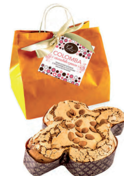
colomba cioccolato e pesca con mandorle 700 gr. € 16.90