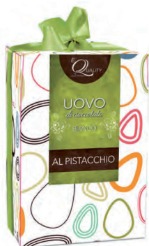
bianco con pistacchi. 350 gr. € 17.50

Le uova di cioccolato E-Quality esprimono l'eccellenza del cioccolato in 4 golose proposte in scatole regalo. Non contengono sorprese all'interno, perchè la vera sorpresa è il Gusto.