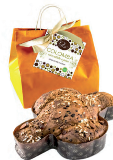
colomba bio cioccolato-pera con glassa e mandorle 750 gr. € 17.90