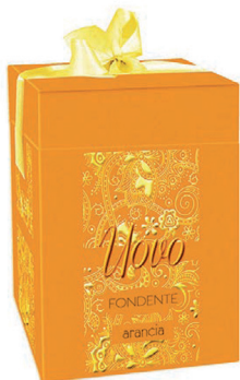
fondente extra e arancia. 350 gr. € 14.50