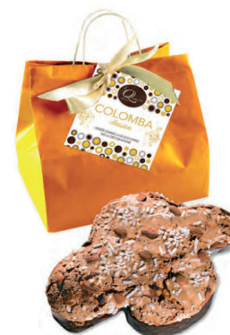
colomba classica bio con glassa, mandorle e granella di zucchero 750 gr. € 17.50